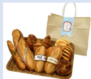
▲売れ残ったパンの詰め合わせ『ツナグパン』

売れ残ったパンを詰め合わせ、定価の約6割で翌日販売するシステム「ツナグパン」を令和3年12月に開始。購入者にはチェーン全店で使える100円相当の「エシカルコイン」を贈呈し、同額のコインを提携支援先の福祉施設にも贈呈して、フードロスの削減と社会的弱者の自立支援に貢献。