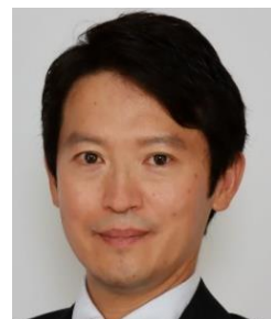
齋藤 元彦 知事