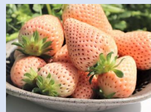
▲淡路島の白いちご『淡雪（あわゆき）』

廃食用油を飲食店などから回収し、飼料原料・ハンドソープ・BDF（バイオディーゼル燃料）などに再利用。また、農業にも取り組んでおり、淡路島の廃校において、BDFを活用したビニールハウスでイチゴを生産・販売。