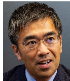
蟹江 憲史 教授

1969 年生まれ。日本における SDGs 研究の第一人者。 国連が4年に1度まとめる『グローバル持続可能な報告書(GSDR) 2023 年版』の執筆を行った世界の 15 人の専門家の1人。 日本政府の SDGs 推進本部円卓会議構成員などを兼任。