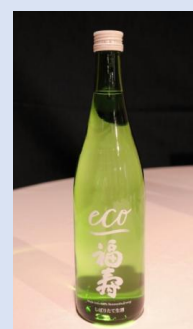
▲世界初カーボンゼロの日本酒『福寿 純米酒 エコゼロ』

日本酒の製造工程において、100%再生可能エネルギーとカーボンニュートラルな都市ガスの利用、ビンの再資源化、酒粕の再利用、資源の保全と節水などに取り組み、令和4年10月には、世界で初めて製造工程におけるカーボンゼロ（二酸化炭素排出量が実質ゼロ）を達成した日本酒を販売。