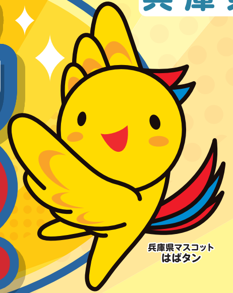
兵庫県マスコット はばタン